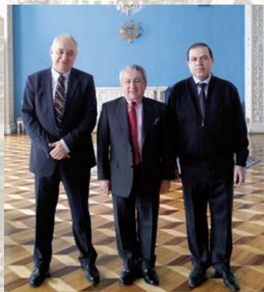
Организаторы и участники I Международного конгресса Евразийской морской истории 2012