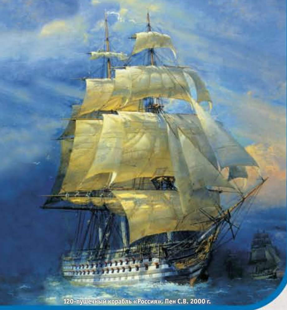
120-пушечный корабль «Россия», Пен С.В. 2000 г.